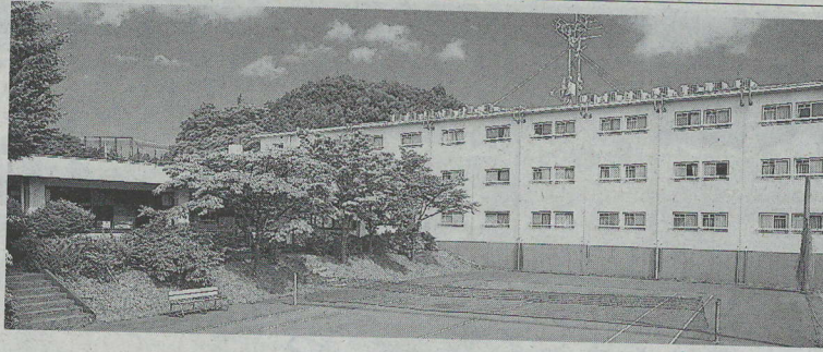
久敬社塾の寮生棟川崎川崎区